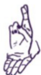
Ilustración: Candela Goldschmidt - Diseño: Equipo Sordas Sin Violencia

6. La oyente le da la información en forma abreviada. No hay comunicación accesible.